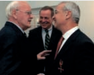
▲ Zählte zu den ersten Gratulanten: Alt-Bundespräsident Professor Herzog

KAFKA 2005 im Netz www.ghst.de/links/kafka