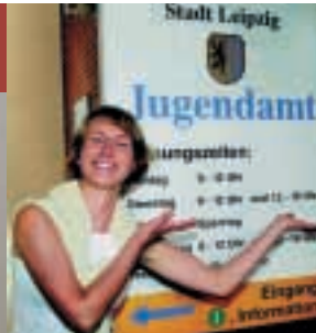
▲ Praktische Erfahrungen sammeln und den Horizont erweitern: Die KAFKA-Teilnehmer durchlaufen ein maßgeschneidertes Fortbildungsprogramm