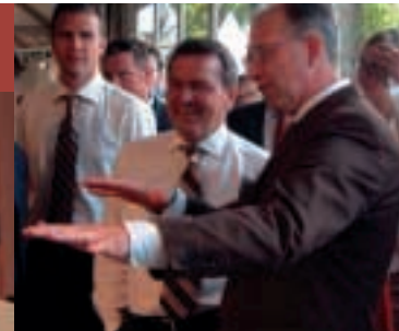
▲ Die richtige Balance finden – die Beruf und Familie gGmbH zu Gast beim Tag der offenen Tür der Bundesregierung