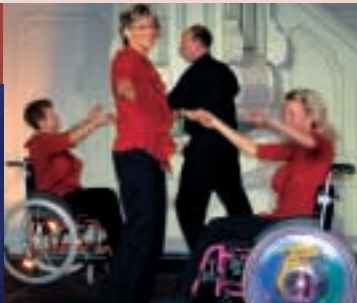
▲ Ausgezeichnet: die MS-Rollstuhltanzgruppe Petershagen/Eggersdorf