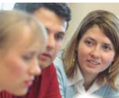
▲ Ein erfolgreiches Netzwerk junger Europäer: der Kreis der Hertie-Stipendiaten soll weiter wachsen.