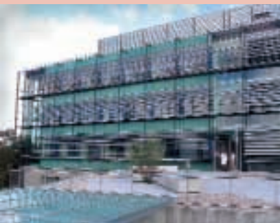
▲ Das Hertie-Institut in Tübingen