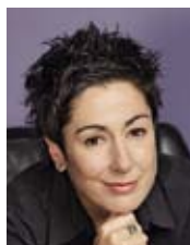
DUNJA HAYALI (37), FERNSEH- JOURNALISTIN.

Die Moderatorin ist Mitglied im Beraterkreis der START-Stiftung, die Stipendien an Schüler mit Migrationshintergrund vergibt.